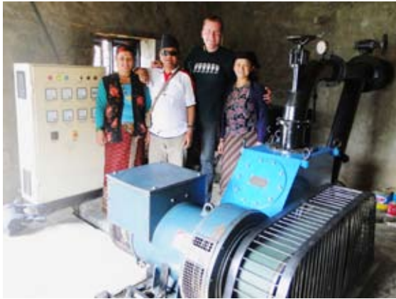
Mit dem Wasserkraftwerk im Bergdorf Singdi hat der FNH bereits Erfahrungen im Bereich Alternative Energien sammeln können. Tanka, Alex und 2 Frauen aus Singdi begutachteten den Stromgenerator mit Turbine.

Weise sind wir sowohl in der Lage bereits bestehenden Unternehmen für Alternative Energie die notwendigen