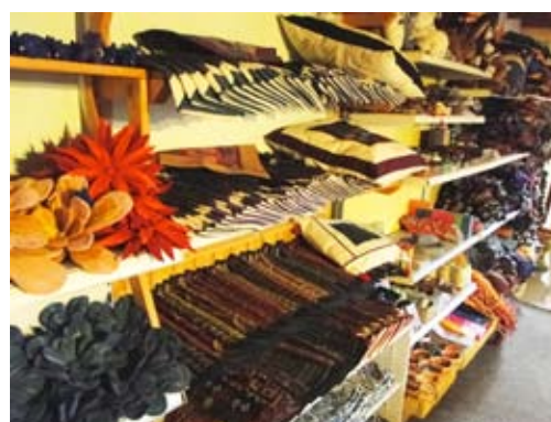
Ein Ausschnitt aus dem umfangreichen Warensortiment an Handarbeiten von Alexander Schmidt