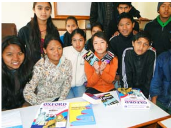
Die Hostel-Jugendlichen in ihrer kleinen Bücherei

I n diesem Jahr sind wieder 3 Mädchen und vier Jungs vom Kinderdorf ins Hostel übergewechselt. Insgesamt haben wir jetzt 19 junge Leute im Hostel.