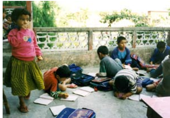
Bilder aus den Anfängen des Vereins