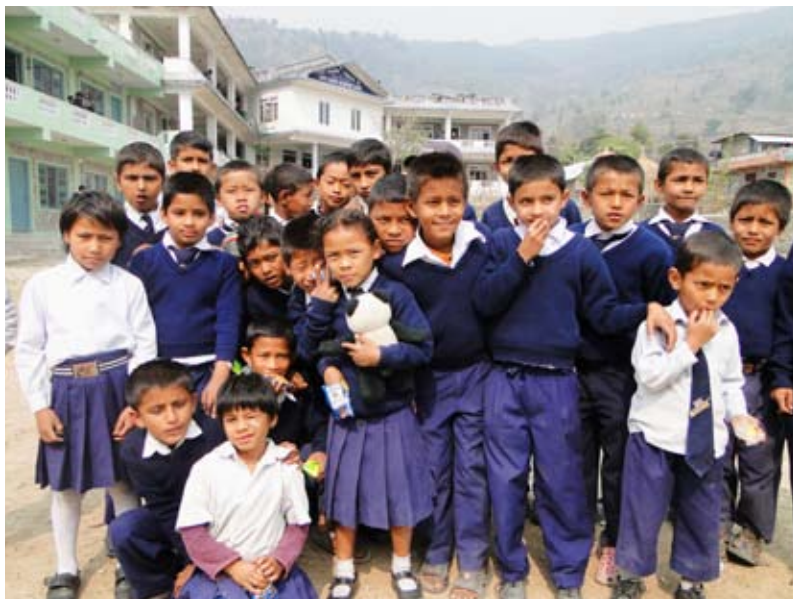
Bis zur vierten Klasse gehen die Kinder noch zur Shree Shanta Secondary School