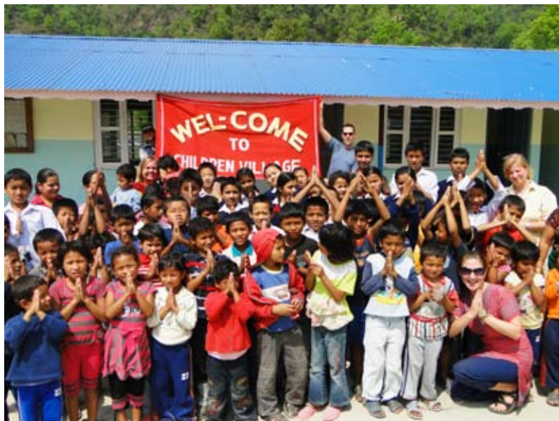
Gruppenbild vor dem neuen Kindergarten

In diesem Jahr wollen wir 14 neue Kinder aufnehmen. 4 neue Kinder sind schon da. Um diese Kinder aufnehmen zu können, brauchen wir dringend noch Partnerschaften. Mit 1,20 Euro am Tag können wir ein neues Kind versorgen. Dieser Betrag ist nicht viel und hilft einem Kind aus bitterstem Elend heraus zu kommen. Seitdem die großen Kinder, 9. und 10. Klasse, nicht mehr im Kinderdorf sind, wuseln überall viele kleine und vor allem neue Zwerge herum. Für unsere Mitarbeiter ist das eine echte Herausforderung, täglich so viele Kin-