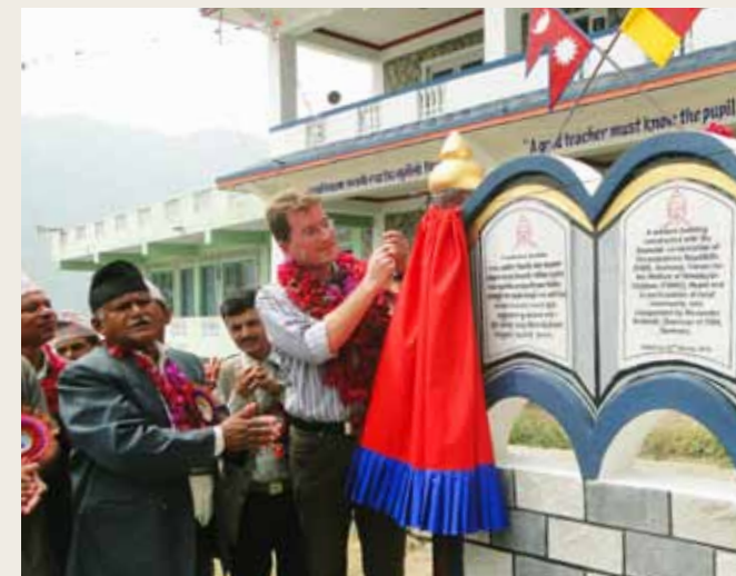
rechts oben: Einweihungsfeier in Singdi rechts unten: Festakt zur Grundschuleröffnung