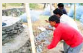
Bau von Schutzwällen mit Hilfe von Gabionen 2008