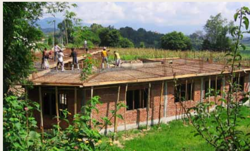
oben: Festakt anlässlich des 10-jährigen Bestehens des FWHC/FNH 2005 unten: Hostelbau 2006