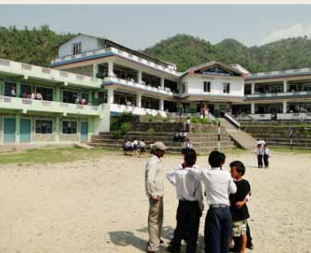
Shree Shanta Secondary School mit neu gebauter Grundschule 2009

2008 Über 20 Tonnen galvanisierten Eisendrahts werden zu Drahtkäfigen (Gabionen) verwebt, mit Steinen gefüllt und in Schutzwällen um das Kinderdorf und den Ort Bhakunde gelegt sowie in den Erdrutschbächen zu Staustufen aufgeschichtet. Einführung eines Managementkomitees und neuer Arbeitsverteilung unter allen Mitarbeitern. In der Bücherei entsteht ein einfaches Labor für Naturwissenschaften. Das Hostel in Kathmandu erhält einen gepflasterten Innenhof mit Umgebungsmauer. Mit Unterstützung des BMZ wird das Dorfentwicklungsprojekt von Singdi im Lamjung Distrikt durchgeführt. Eine Gesundheitsstation und ein Wasserkraftwerk zur Stromversorgung werden dort gebaut. Im Kinderdorf werden 2 überdachte Spielplätze für Kinder und ein mit Steinbänken eingerichteter Versammlungsplatz gebaut. Erste Jugendliche verlassen das Hostel und beginnen ein Studium im Bereich Hotelmanagement bzw. Betriebswirtschaft.