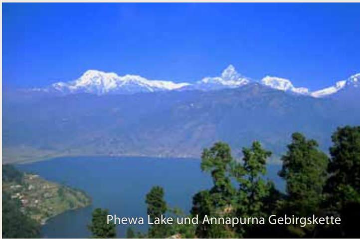
Phewa Lake und Annapurna Gebirgskette