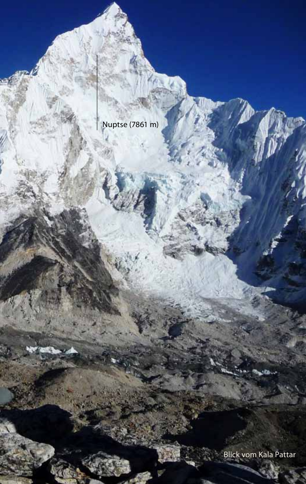
Nuptse (7861 m)