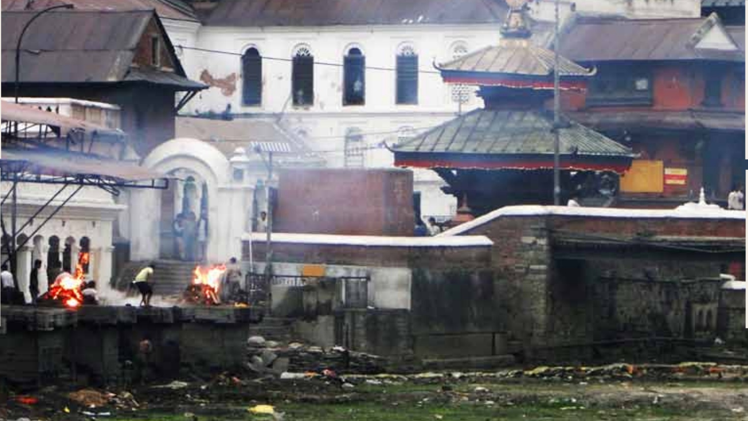
Hinduistische Tempelanlage Pashupathinat in Kathmandu