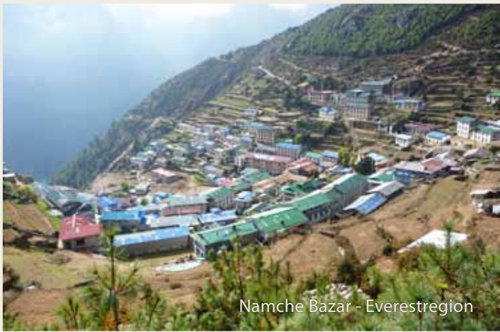
Namche Bazar - Everestregion