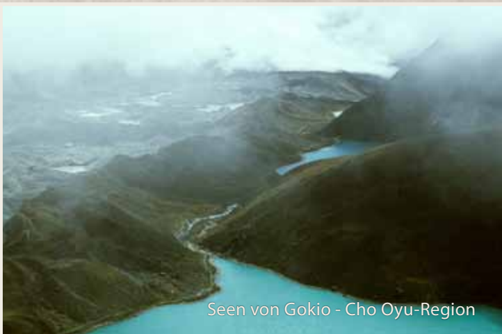
Seen von Gokyo - Cho Oyu-Region